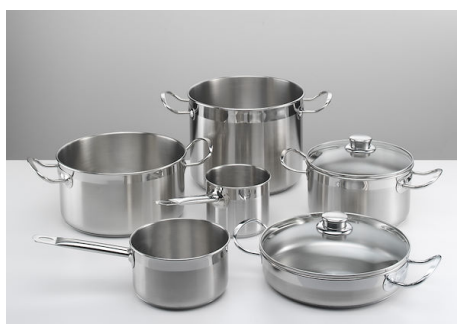
Série de pots induction PRO 8pcs. 8210 008