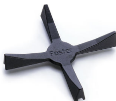
Support de Wok en fonte 9601 668